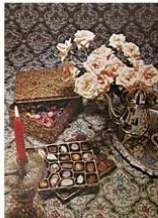
昭和40年代発売トリプルボックス (TRIPPLE BOX)